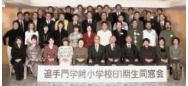
追手門学院小学校81期生同窓会

快晴で、この時期としては珍しい位温かい絶好の同窓会日和に恵まれた平成14年1月13日(日)に、5人の先生方と42人の同期生が集い、小学校81期生の同窓会を行いました。小学校81期生は、卒業以来同窓会を行った事が無く、実に32年振りの再会となりました。 当日は、まず小学校に集まり、懐かしい母校を見学させて頂いた後、場所を変えてパーティーと二次会を行う3部構成で同窓会を行いました。