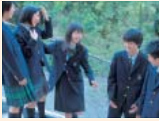
コース制の導入を柱とした学校改革に取り組み、この四月で三年目を迎えました。年が明ければコース制の第一期生が卒業することになり、その成果が問われます。この間の取り組みを中心に、中・高の近況を報告します。

高等学校は学級定員を従来の46名から40名に変更し、240名の募集としました。これは、教育条件の向上と内部中学生のクラス減への対応を考慮したものです。 本年は内部生の頑張りにより、36名の中から英数コースに5名、理数コースに5名の合格者を出し、外部からの受験生の倍率は次のようになりました。英数コース10.9倍、理数コース6.1倍、総合文理科コース1.9倍。なお、総受験者数935名、うち外部受験者数157名であり、これは昨年比50%増でした。このことは追手門の学校改革が外部で評価され、中