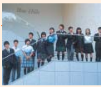
科の「数値目標」を設定し、その達成度を外部模試の結果で点検することで、外部模試を軸として教科の指導・学習が行われるようになりました。

第一に、授業の充実を図るために、中・高ともに新学期当初に「学習オリエンテーション」を実施し、学期ごとの対生徒「授業アンケート」により授業の改善を試みました。結果として、生徒・教師ともに授業に対する意識が高まりました。これに加えて、今年度は公開授業制度を導入しました。 第二に、総合文理科コースにおいて「英語の習熟度別授業」を実施し、成績に応じて学期ごとの授業クラス編成替えを行いました。これにより、学力に応じた手厚い指導を受けられ、理解が深まり、良い意味での競争意識が生徒の中に生まれました。また、成績不振者に対しては、中・高ともに「フィードバック学習」の手当てを行い、大学進学に向けては毎日7限後の2時間のアドバンスセミナーを実施し、22講座245名の参加がありました。さらに今年度は、高三の進学面での数値目標を達成するために、6時以降の特別セミナーを開講し、また、教員の教科指導力向上に向けて、代々木ゼミナールと提携した教員研修を実施しています。 第三に、年度当初に、各コース・各教